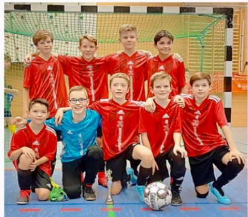
Entschieden das vereinsinterne Endspiel für sich: Die D-Junoren der SF BG Marburg IV.

SF BG Marburg I zu. Davon war auf dem Feld allerdings wenig zu merken. Mit 4:2 setzten sich die „Schimmelreiter“ überzeugend durch. Als Dritter kam die JSG Michelbach/Marburg ins Ziel, die den JFV auf Rang vier verwies.