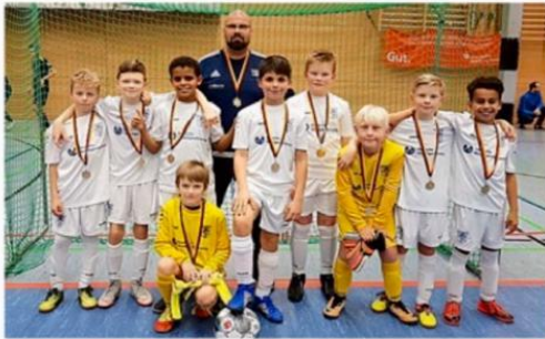
Die E-Junoren des VfB Marburg präsentieren ihre Medaillen nach dem Endspielsieg gegen die SF BG Marburg.