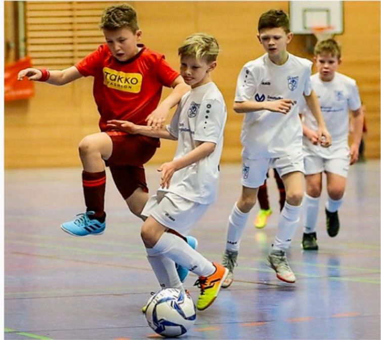
Beim Turnier der E-Junoren standen sich unter anderem der JFV Ohmtal-Kirchhain II und der VfB Marburg gegenüber. Der VfB gewann das Turnier letztlich.