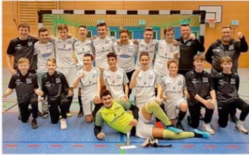
Sicherten sich überraschend den Turniersieg: Die C-Junoren des JFV Ohmtal-Kirchhain.